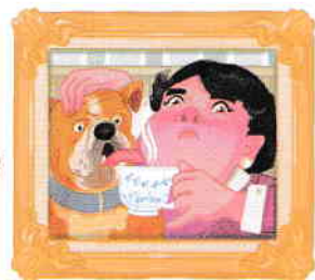
Mătușa Marge și câinele Ripper (vizitele lor îl indispu- nerabil pe Harry)

Harry e orfan. Crede că e un copil obișnuit.