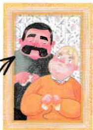
Unchiul Vernon (se plânge intruna, în special de Harry)

Harry Potter stă pe Aleea Privet numărul 4 de când era mic, găzduit de sinistrelle lui rude – mătușa, unchiul și un verișor.